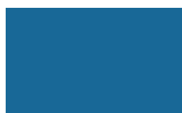
Cor: 5016 150/300 cm