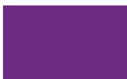
Cor: 5278 150/300 cm