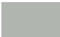
Cor: 7060 150/300 cm