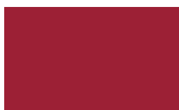
Cor: 3088 150/300 cm