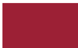
Cor: 3006 150/300 cm