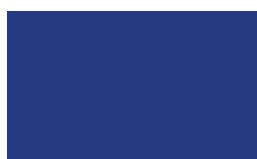
Cor: 5094 150/300 cm